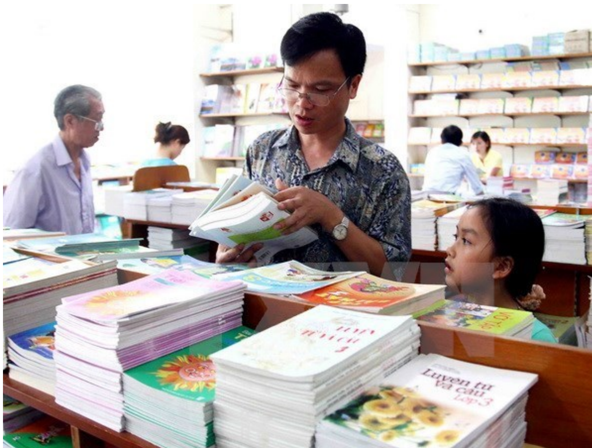
(Ảnh minh họa: